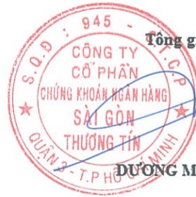
DƯƠNG MẠNH HÙNG