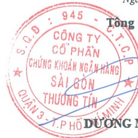
DƯƠNG MẠNH HÙNG